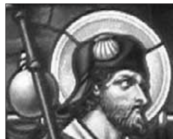
hlavní atribut - mušle, detailně

Roku 813 prý objevil apoštolův hrob za pomoci andělů poustevník Pelagius. Protože mu polohu hrobu prozradily jasné hvězdy, začalo se toto místo latinsky nazývat „campus stellae“, což znamená „jasné pole“. Z toho prý vznikl i název Santiago de Compostella. Od té doby tam začali chodit poutníci a dodnes patří Compostella mezi hlavní poutní místa světa. Proto je svatý Jakub patronem všech poutníků. (jihá)