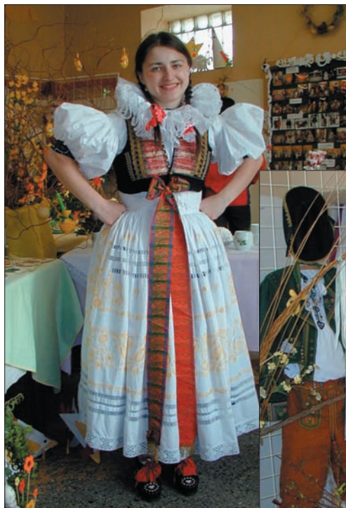
na výstavě poletovala rozšafná a usměvavá hanačka

Bylo to moc hezké a příjemné odpoledne. Jen škoda, že zájem veřejnosti prý nebyl velký. Souviselo to však i s nevelkou a skromnou propagací výstavy. Byli jsme vlastně posledními návštěvníky výstavy protože jsme na výstavě vytrvali až do „zavíračky“. Zároveň jsme od pořadatelů dostali i zvláštní pochvalu, protože jsme byli „nejdelšími“ návštěvníky výstavy. Strávili jsme totiž v přítomnosti příjemných a pohostinných pořadatelů téměř dvě hodiny. (frvo)