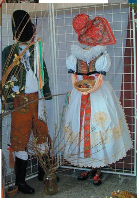
vystavené hanácké kroje