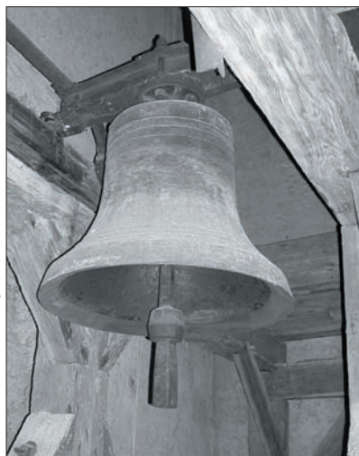
„válečný zvon“ z r. 1918

V roce 1920 po více jak dvouletém čekání, psaní, dopisování, došly z Karpfenberku dva ocelové zvony. První (je zde dodnes) z nich váží 510 kg a má průměr 1 metr, je označen jako „válečný zvon 1918“, má tón „GIS“. Na zvonu je nápis: KRIEGSGLOCKEN ANGEFERTIGT... (pokračování je pod trusem). Druhý váží 50 kg a má průměr 45 cm, byl určen