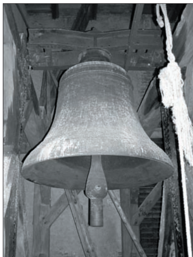
„sv. Urban“ z r. 1922

V prosinci 1923 posvětil místní farář zvon, na který se váže historka: tento zvon byl určen jako hřbitovní, avšak