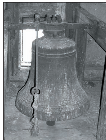
„umíráček“ z r. 1923

nemohl být k tomu účelu použit, protože je příliš velký a těžký, na věžičku hřbitovního kostela nevhodný. Byl proto vytažen na věž farní kostela a zavěšen místo umíráčka (je tam dodnes). Původní umíráček z r. 1920 byl sundán a na hřbitově zavěšen. Nový posvěcený zvon je z ocele, dodán firmou Röhler a comp. Z Karpfenberku ve Štýrsku. Váží 130 kg, průměr 75 cm, nápis „Pax aeterna 1923“. má tón „E“. I když by objednan v roce 1919, kvůli Čechům bylo více než rok odepřeno dovozní povolení. Nepomohla žádná intervence poslance a ještě olomouckého arcibiskupa Dr. Stojana. Tak ležel zvon více než tři roky připraven k odeslání v dílně.