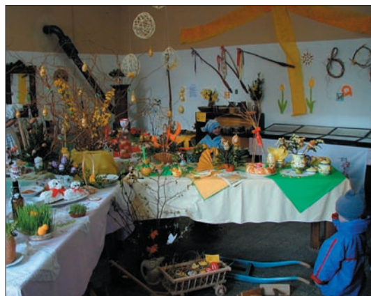
stoly se prohýbaly pečlivě připravenými exponáty