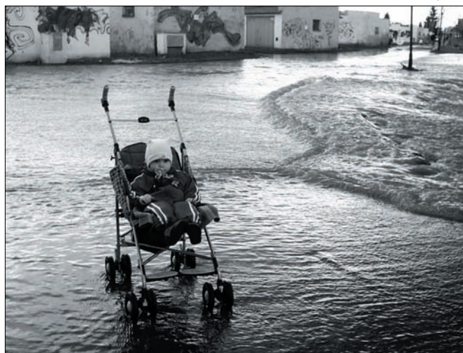
Když se z Uničova stane přístav... (duben 2006)

17. března 1940. Letos byla obzvláště dlouhá a krutá zima. Dlouhodobě měřeny teploty dosahující až k -30°C. 24. března, ve Svatém týdnu, kdy byly slaveny Velikonoce, byla sněhová chumelenice s teplotou -13 až -15°C. Zemědělci se zmocňují velké starosti, zda zvládnou jarní obdělání půdy, zvláště, když jsou stále více a více muži povolováni k válečné službě. Řez kočíček byl na nejnужnější krajní míru omezen a s větvičkami se muselo při svícení velmi šetrně zacházet, protože vrby jsou podle říšského zákona z 26.6.1935 chráněny jako první včelí potrava. (jihá)