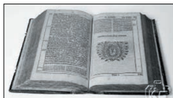
Z FARNÍ KRONIKY

tento 26-ti letý čeledín rozhorlil. Nesmyslným způsobem se stavěl k ženě svého představeného, což bylo také důvodem jeho okamžitého propuštění ze služby. Tento vrah měl pro všechno náboženské jen výsměch a posměch, po celá léta nešel do žádného kostela. Avšak žádný bál a zábavu nezanedbal, celé noci probděl při hrách a pití. Co jiné se mohlo očekávat? Také zde vidíme, kam člověk se špatnou rodinnou výchovou dojde, neb v rodině Altových nevládl žádný křesťanský duch. (jihá)