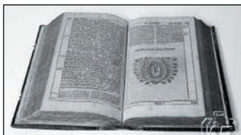
Z FARNÍ KRONIKY

Ríjen a listopad 1918. V měsících říjnu a listopadu řádila chřipka s mnoha zápaly plic. Bylo 7 úmrtí: 4 z města a 3 cizí ve zdejší nemocnici zemřeli. Obecné a měšťanské školy byly na měsíc uzavřeny, od 7.10. do 6.11. V chlapecké obecné škole z 262 žáků 148 onemocnělo. Právě tak z dívčí obecné školy a obou měšťanských škol přes polovinu dětí onemocnělo.