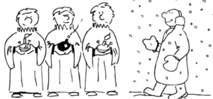
Tříkrálová mše začala velkým třeskem.