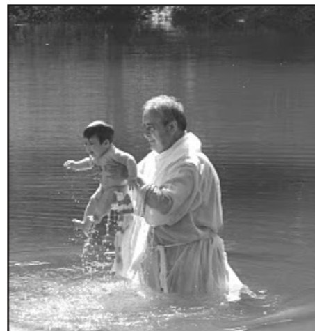
K est dít te na míst Ježíšova k tu v ece Jordán.